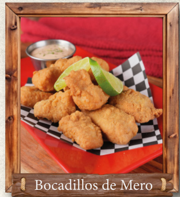
Bocadillos de Mero